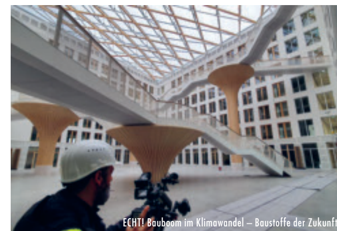
ECHT! Bauboom im Klimawandel – Baustoffe der Zukunft

Unsere Städte verbrauchen 75 % der weltweit erzeugten Energie und tragen damit maßgeblich zur Klimakrise bei. Doch mit originellen Ideen kann man Städte umweltfreundlicher und lebenswerter gestalten. Engagierte Menschen führen in Polen ohne Unterstützung der Regierung eine lokale Energiewende herbei, bauen in Indonesien erdbebensichere Häuser aus Plastikabfall, sanieren in Deutschland ganze Wohnblöcke zu energiesparenden Gebäuden, verwandeln Städte zu Insektenparadiesen und machen in Kolumbien aus der einst gefährlichsten Stadt der Welt eine lebenswerte grüne Stadt.