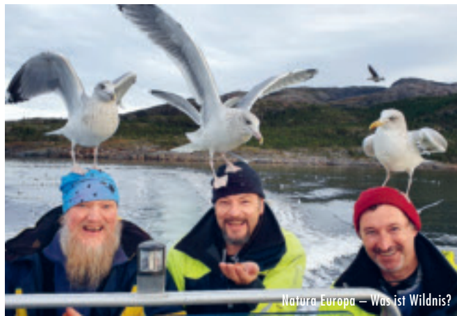
Natura Europa – Was ist Wildnis?