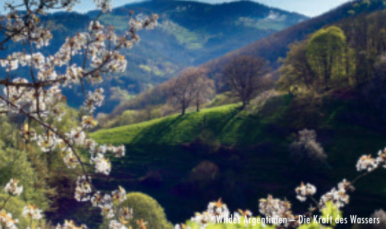
Wildes Argentinien – Die Kraft des Wassers