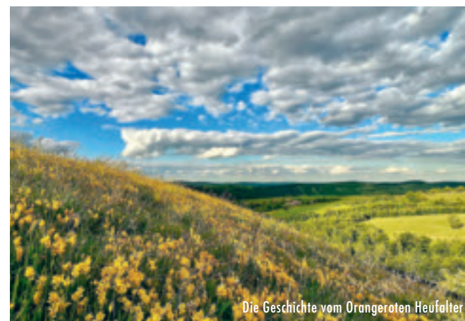
Die Geschichte vom Orangeroten Heufalter