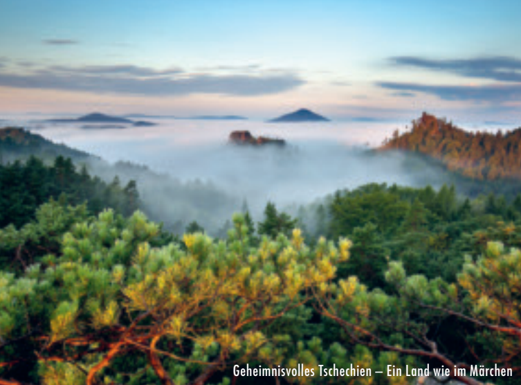
Geheimnisvolles Tschechien – Ein Land wie im Märchen