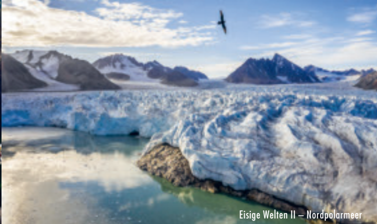
Eisige Welten II – Nordpolarmeer